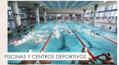
PISCINAS Y CENTROS DEPORTIVOS