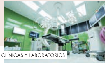
CLÍNICAS Y LABORATORIOS