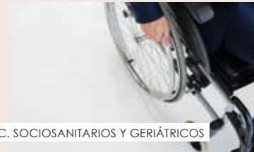
C. SOCIOSANITARIOS Y GERIÁTRICOS