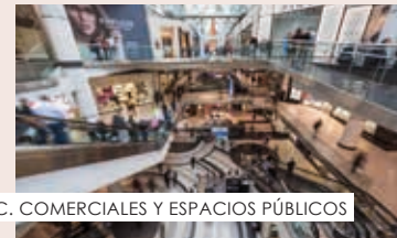
C. COMERCIALES Y ESPACIOS PÚBLICOS