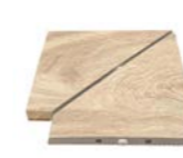
ESQ. REJILLA CERÁMICA PRO AM-13045 JG/122 280 x 280 x 22