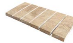
REJILLA CERÁMICA PRO AM-13031 PZ/191 500 x 245 x 22