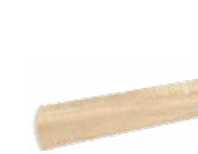
ÁNGULO CURVO AM-6595 PZ/133 310 x 36 r=35