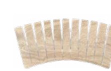
REJILLA CERÁMICA PRO CURVABLE AM-13058 PZ/123 500 x 245 x 22