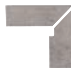
ZANQUÍN RECTO CORTE FU-1908 Drcho. FU-1911 Izdo. 305 x 270 x 86