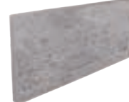
TABICA DOMUS G3 FU-747 310 x 150 x 28