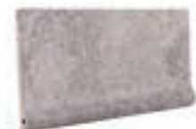
TABICA FU-1137 310 x 150 x 28