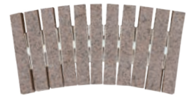
REJILLA CURVABLE EVACUACIÓN: 19 m 3 /h FU-7265 500 x 245 x 25