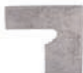
ZANQUÍN FIORENTINO FU-907 Drcho. FU-921 Izdo. 288 x 270 x 86