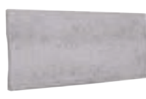
TABICA ONDULADA FU-775 310 x 150 x 22