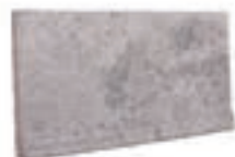
TABICA DOMUS FU-733 310 x 150 x 20