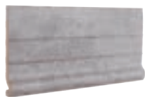
TABICA G1 FU-1231 310 x 150 x 28