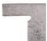
ZANQUÍN VIERTEAGUAS FU-1052 Drcho. FU-1058 Izdo. 310 x 270 x 86