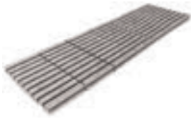
REJILLA CERÁMICA EVACUACIÓN: 19 m 3 /h FU-2376 500 x 245 x 25