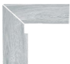
ZANQUÍN RECTO CORTE Dcho.YU-930 JG/112 Izq.YU-954 JG/112 305 x 270 x 86