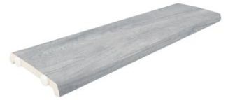
REJILLA OCULTA REGISTRABLE YU-2353 PZ/126 500x126x20 mm (Grosor 12mm)