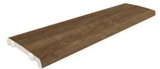
REJILLA OCULTA REGISTRABLE TA-2373 PZ/126 500x126x20 mm (Grosor 12mm)