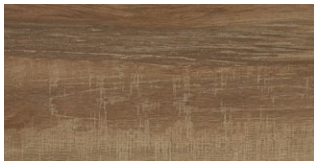
BASE TA-1290 M 2 /003 625 x 310 x 10